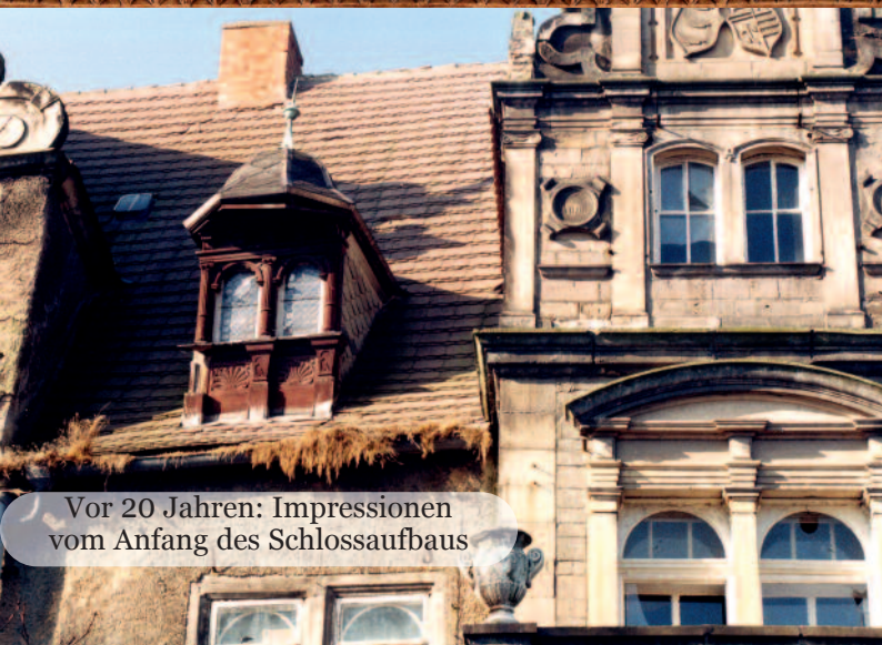
Vor 20 Jahren: Impressionen vom Anfang des Schlossaufbaus

Schlossführungen sonntags 15:00 Uhr & nach Vereinbarung